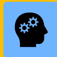
Formações entre Pares