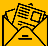
Boletim de Notícias