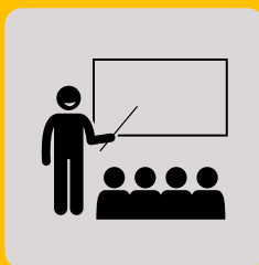
Formações Técnicas sobre Regulação