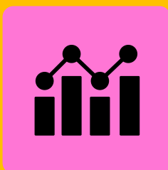
Estudos e Relatórios