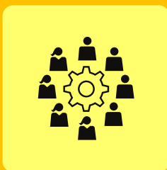
Grupos de Trabalho